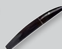
Virtuose Black Carat