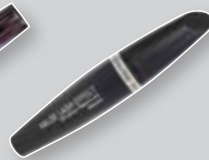
Max Factor False Lash Effect