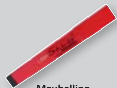
Maybelline Stiletto Volume