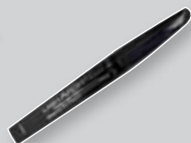
L'Oréal Lash Architect