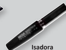
Isadora Mega Mascara Lengthening