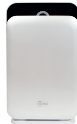
Alfda ALR300 Comfort