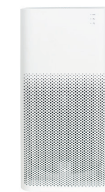
Xiaomi Mi Air Purifier 2H AC-M9-AA