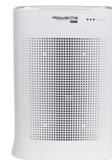
Rowenta Pure Air Genius PU3080