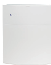
Blueair Classic 280i