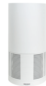
Soehnle AirFresh Clean Connect 500