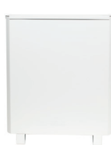
Woods AL 310 / ELFI 300