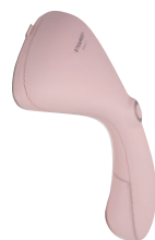
Steamery Cirrus No.2 Steamer