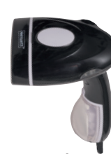
Jula Menuett, Portabelt ångstrykjärn, 1300 W