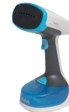
Tefal Access Steam Minute