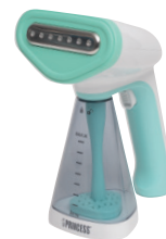
Princess Steamer Portabel Travel